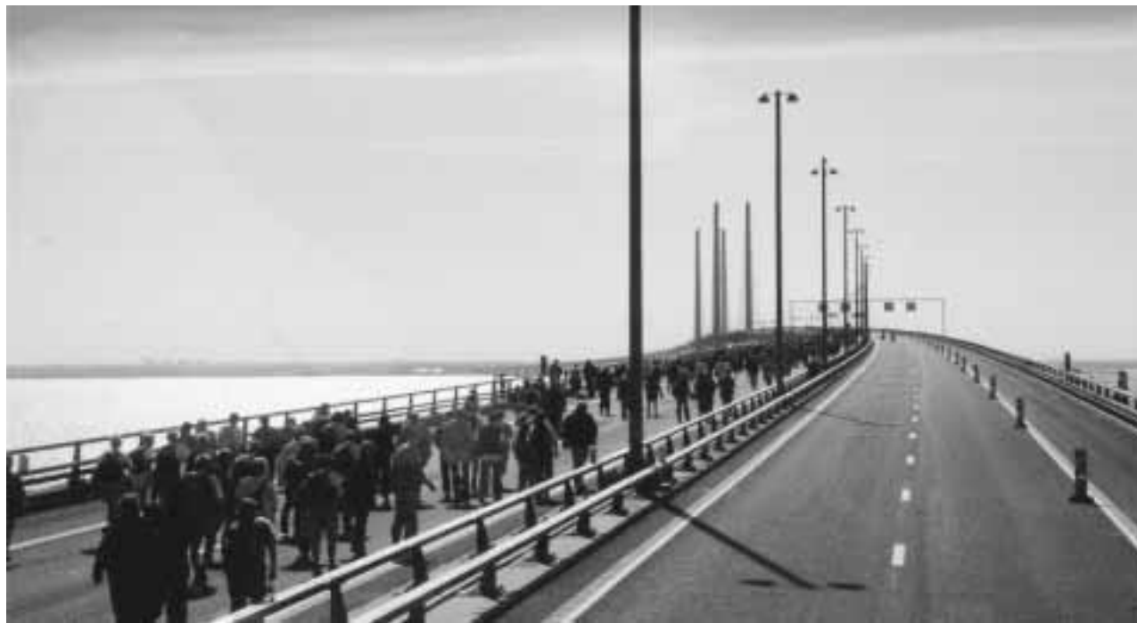
"På nogen strækninger er der så få biler på motorvejene, at befolkningen tror, at det er en gågade!"

Det er derfor vigtigt, at man får set nærmere på den danske demokratimodel i forhold til demografien i landet, herunder at København/Hovedstaden kan få valgt egne borgere i Folketinget for den "jyske mafia" har flertal, og de bruger den til gunst for sig selv