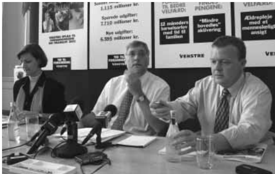
Da Venstre fremlagde sit finanslovsoplæg i sommeren 2001 var ambitionsniveauet højt, men hvad de lovede i oppositionen, holdt de, da de kom i regering.

Der bør ikke grædes mange tårer over, at den tidligere regerings skattekrue er væk. Nu handler det om bedre velfærd for danskerne og bedre vilkår for dansk erhvervsliv.