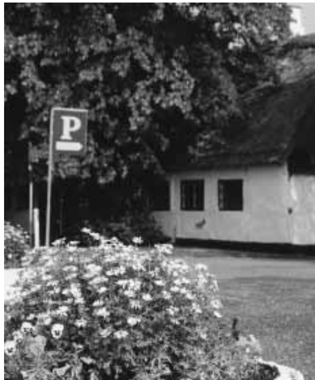
Støtte til landbruget skal i såvel øst som vest afskaffes på sigt!

støtteordninger reformeres - og på sigt helt afskaffes, men den vil naturligt nok helst undgå, at der skal forhandles om landbrugsordningerne samtidigt med udvidelsesafslutningen. Det bekymrende er, at såfremt man ikke nøje overholder den tidsplan for optagelsesforhandlingerne, der er lagt, så bliver udvidelsen ikke til noget under det danske formandskab. Og det vil være fortrædeligt og svært at bære. Ikke fordi det er det danske formandskab, men fordi det vil være overordentligt pinligt, hvis EU ikke - efter så mange års løfter - nu får de nye lande ind i fællesskabet. Det skal være første prioritet af hensyn til Europas fremtid, - så må regningen komme i anden række.