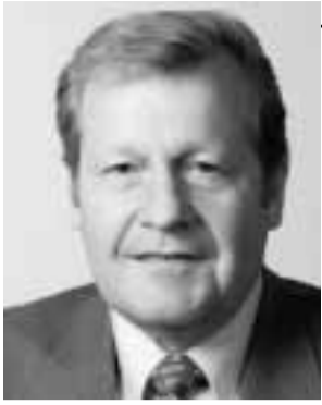
Af skatteminister Svend Erik Hovmand (V)

Igennem de sidste mange år har borgerne oplevet en fortsat stigning i betalingen af skatter og afgifter. Oplevelsen er, at skatteskruen tilsyneladende ingen ende har.