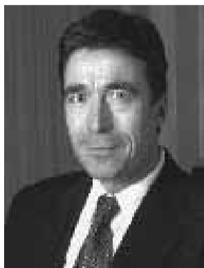
Af statsminister Anders Fogh Rasmussen