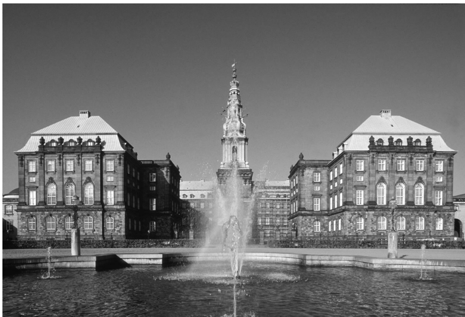
Billedet er for lavt opløst - kan ikke blive større!

Jeg glæder mig til debatten, og jeg glæder mig til, at der nu også er åbnet for at der kan komme liberale bud på fremtidens struktur.