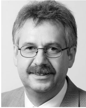
Af miljøminister Hans Chr. Schmidt

Den 26. august går det løs. Over hundrede stats- og regeringsledere og ledere af internationale organisationer og op mod 60.000 deltagere mødes i den syd-afrikanske by Johannesburg for at diskutere og træffe beslutninger om bæredygtig udvikling.