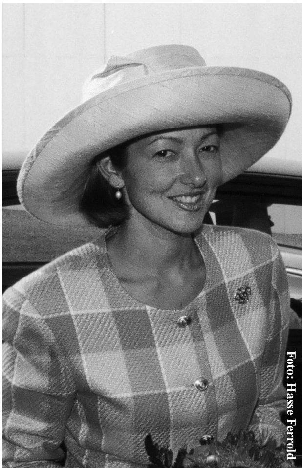
H.K.H. Prinsesse Alexandra, velintegreret - uden modersmålsundervisning.