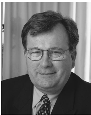
Af beskæftigelsesminister Claus Hjort Frederiksen

På Beskæftigelsesministeriets område er overskriften for det danske EU-formandskab rummelighed gennem social dialog og partnerskaber. Under den overskrift gemmer der sig bl.a. en debat om virksomhedernes sociale ansvar.